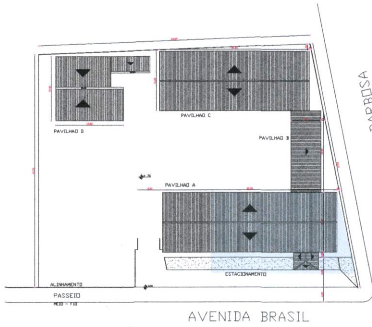
PLANTA DE SITUAÇÃO E LOCALIZAÇÃO ESCALA: 1/750